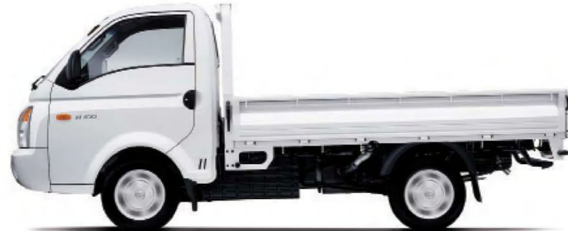
H100 by Dodge Diesel Pickup

Para saber más, visita camionesram.com.mx