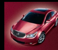
Rojo Oscuro Metálico